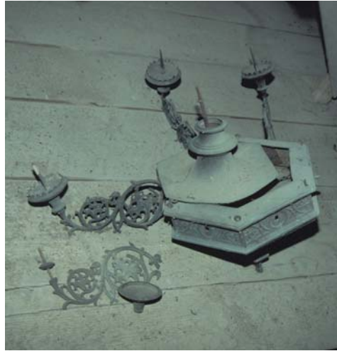
Lagerung auf dem Dachboden: Der Anfang vom Ende!