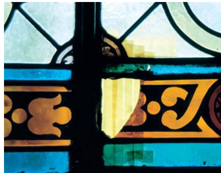
Unsachgemäße Reparatur mit Klebestreifen.

Niemals sollten Farbglasfenster geputzt werden, ohne vorher Fachleute/Restauratoren/innen zu fragen! Malschichten auf historischen und modernen Glasfenstern sind häufig auf die Scheiben aufgebrannt. Sie können sich durch unsachgemäßes Abstauben, Wischen oder Putzen lösen und sind für alle Zeiten verloren!