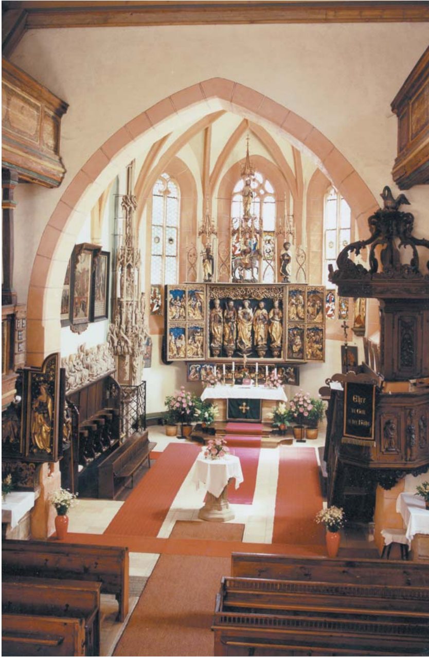
Viele Kirchen sind reich ausgestattet. Evang.-Luth. Kirche St. Andreas in Kalchreuth.