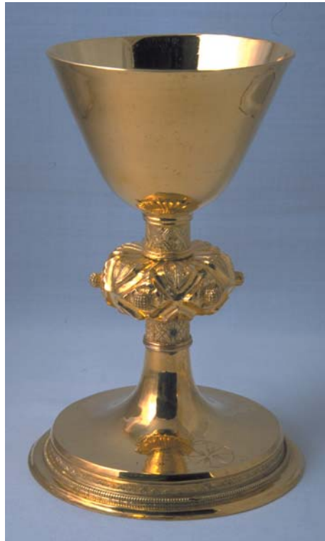
500 Jahre alter Abendmahlskelch aus vergoldetem Silber.

Zu den Vasa sacra (= Heilige Gefäße) in der evangelischen Kirche gehören: der Kelch, die Abendmahlskanne, die Hostiendose und die Patene (Hostienteller) sowie Taufschale und Taufkanne, daneben Haus- und Krankenabendmahlsgeräte und Kelchlöffel. Diese liturgischen Gefäße sind früher und auch heute noch oftmals der Kirche gestiftet worden. Sie wurden von Einzelnen auch unter großen Opfern in ihre Gemeinde geschenkt. Manche Inschrift auf diesen Geräten zeugt von traurigen oder freudigen Ereignissen, vom Tod eines Angehörigen oder der Geburt eines Kindes, die Anlass für die Stiftung waren. Dass solche Stiftungen in Ehren gehalten und sorgfältig gepflegt werden und wenn möglich ihr einstiges Anliegen durch fortwährenden Gebrauch weitergetragen wird, sollte selbstverständlich sein.