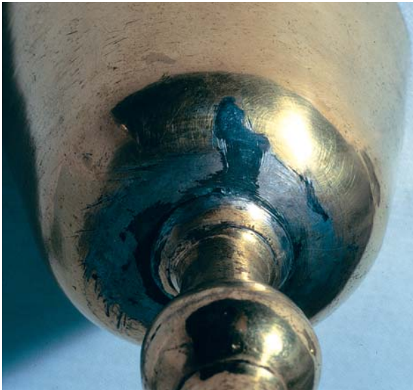
Die Unterseite einer Kelchcuppa mit unsachgemäßer Zinnlötung.

Keinesfalls darf hier selbst Hand angelegt werden! Von Laien durchgeführte Zinnlötungen haben schlimme Folgen für einen Silbergegenstand. Bei dieser billigen „Notlösung“ muss bedacht werden, dass künftige, fachgerechte Restaurierungen sich durch auf Silber vorhandenem Zinn um ein vielfaches schwieriger gestalten und entsprechend teurer werden.