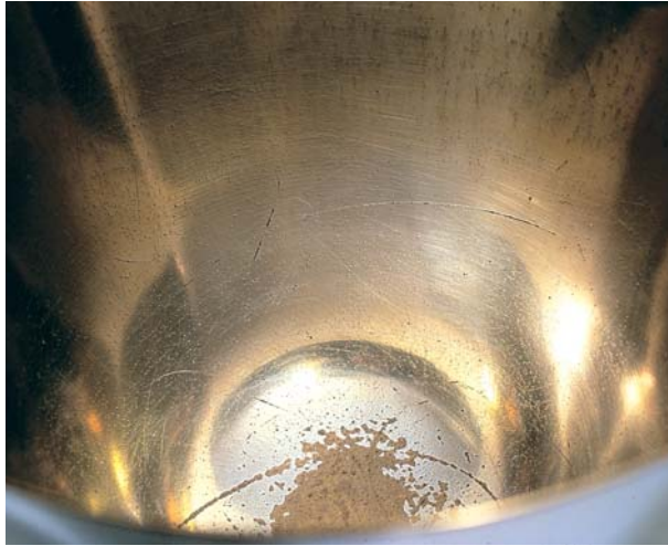
Inneres eines messingversilberten Kelches, von Wein- oder Fruchtsäure zerfressen.