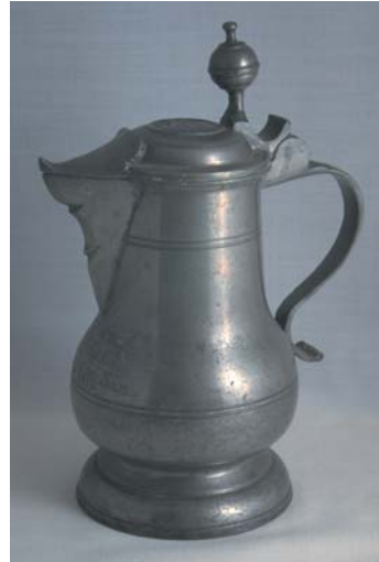
Abendmahlskanne aus Zinn.

Benutzt werden Zinngegenstände heute hauptsächlich noch für die Taufe, manche für das Abendmahl nicht mehr zu verwendende Kanne dient als Taufkanne noch einem würdigen Zweck.