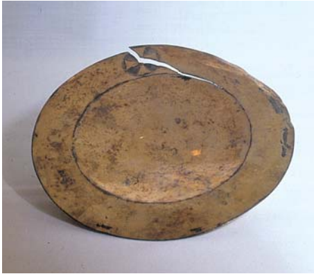
Mittelalterlicher Hostienteller mit Verformungen und langem Riss.

Risse sollten sofort von Fachleuten beseitigt werden, bevor sie sich vergrößern.