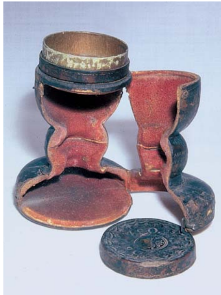
Schönes altes lederbezogenes Etui für Kelch, Patene und Hostiendose.

Eine Neuheit ist ein mit Silberpartikeln behandelter Stoff, der das Anlaufen von Silbergegenständen verhindert. Er kann zum Einwickeln verwendet oder als fertig genähte Säckchen bezogen werden. Dieser Stoff darf nicht zum Putzen verwendet werden (für Bezugsadressen siehe Seite 30ff.). Grundsätzlich ist bei der Aufbewahrung