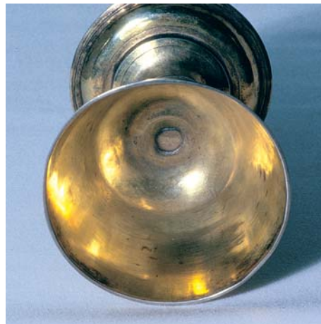
Blick in eine Kelchcuppa. Der Boden der Trinkschale ist durchgerissen, da das Gewinde im Fuß des Kelches zu stark angezogen wurde.

Außer an der beschriebenen Stelle treten Risse häufig am Lippenrand oder am Fuß auf. Auch aus einer starken Verformung, beispielsweise nach einem Sturz, kann leicht ein Riss entstehen.