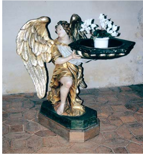
Taufengel sind keine Blumenständer!

Als Alternative zu Altar- oder Taufsteinschmuck reicht manchmal eine schlichte Bodenvase oder ein Tischchen mit entsprechendem Blumenschmuck.