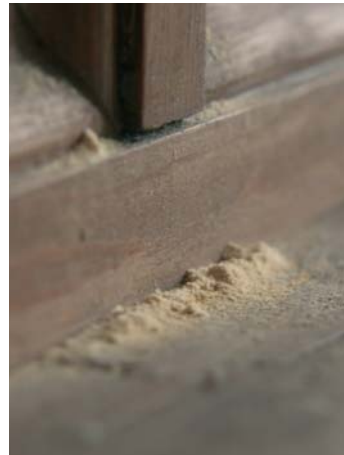
Wurmbefall an einer Empore.

Holzschädlinge sind eine große Gefahr. Deshalb sollte die hölzerne Ausstattung