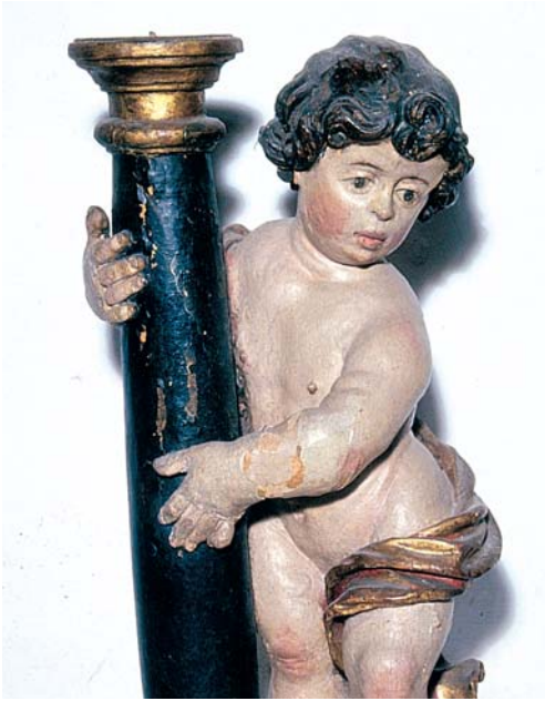
Holzfigur mit loser und teilweise abgeplatzter Fassung.

Viele Gegenstände im Kirchenraum bestehen aus Holz: Altäre, Kanzeln, Taufbecken, Emporen, Gestühl, Orgelgehäuse, Epitaphien, Tafelbilder und Figuren. Sie alle sind oft mit wertvollen Farbfassungen versehen. Holz reagiert als organisches Material auf jede Temperaturschwankung. Es dehnt sich aus und zieht sich zusammen bei wechselnder Temperatur und Luftfeuchtigkeit. So können Risse und Sprünge entstehen und Holzverbindungen sich lösen.