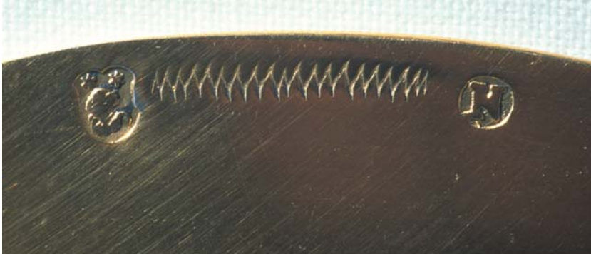
Meisterzeichen, Tremolierstrich und Beschauzeichen der Stadt Nürnberg (N) auf dem Rand einer silbervergoldeten Patene.

In vielen Fällen sind silberne Gefäße an ihren eingeschlagenen Stempeln oder Goldschmiedemarken kenntlich. Vor