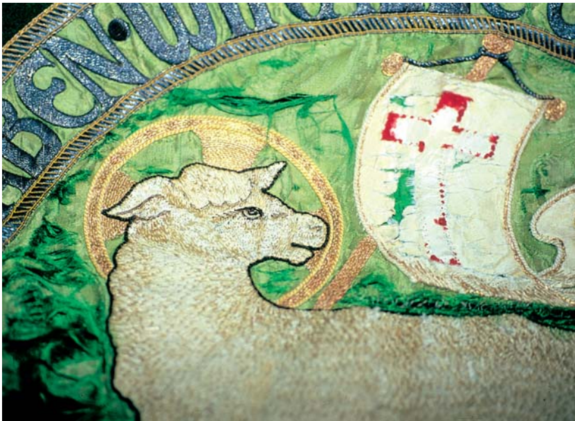
Parament mit zerschlissenem, brüchigem Stoff und abgewetzter Stickerei.

Lassen Sie die Aufhängung der Kronleuchter regelmäßig vom Fachmann überprüfen.