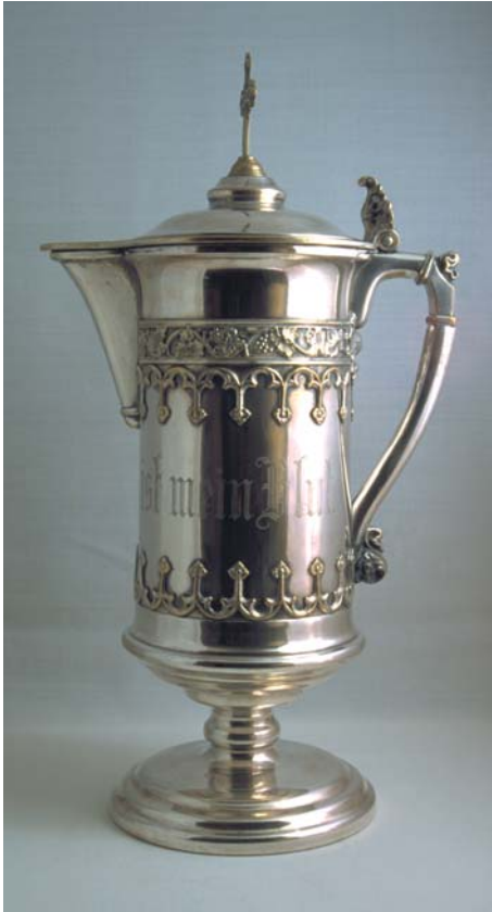
Abendmahlskanne aus unedlem, oftmals gesundheitsschädlichem Material.

Seit etwa 1850 bis heute werden auch kirchliche Gerätschaften industriell aus Messing hergestellt, versilbert bzw. vergoldet und meist über Kataloge vertrieben. Diese kunstindustrielle Serienware aus minderwertigem Material weist jedoch erhebliche Schwächen auf.